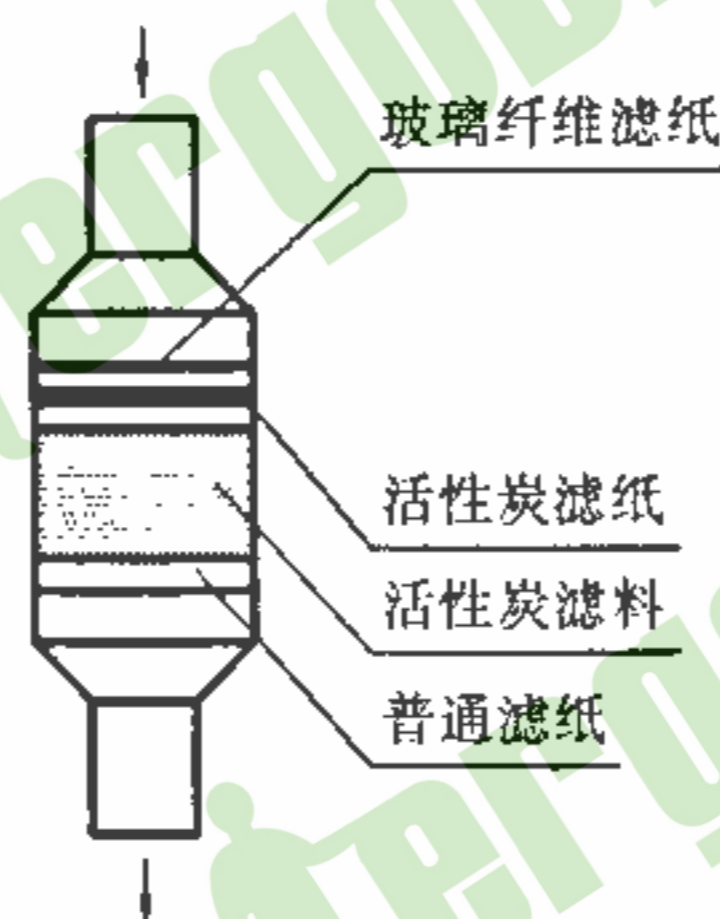
图 2 组合取样器示意图

5.1.1 空气取样器:由滤料、固料夹组成。固料夹主要起固定滤料和引导气流的作用,可用不锈钢或合金铝加工制成。固料夹限定滤料的有效采样面积宜与探测器的直径相配合,一般采样直径较探测器的直径小,常用采样直径约 25~50 mm。组合取样器如图 2 所示。