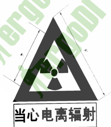
图 F2 电离辐射警告标志

电离辐射的警告标志如图 F2 所示。警告标志的含义是使人们注意可能发生的危险。其背景为黄色，正三角形边框及电离辐射标志图形均为黑色，“当心电离辐射”用黑色粗等线体字。正三角形外边 a_1=0.034L ，内边 a_2=0.700a_1 ， L 为观察距离。