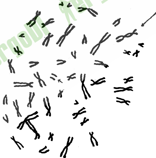
图 B3 双着丝粒和伴随断片