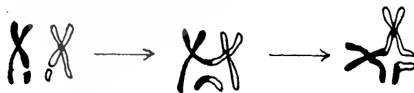
图 B6 染色单体的非对称性互换