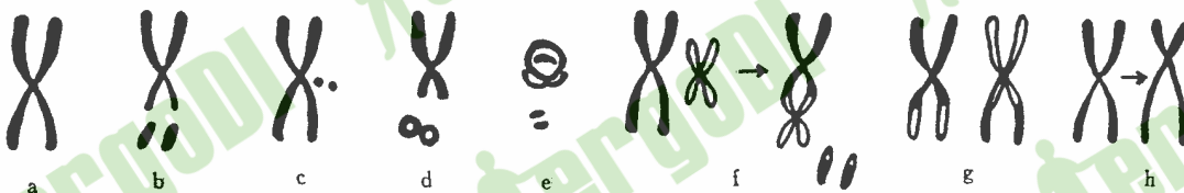
图 B1 各种类型的染色体型畸变模式图

染色体畸变是辐射作用的敏感指标之一。因而,准确认识畸变类型,对生物剂量估算的准确性,有十分重要的关系。