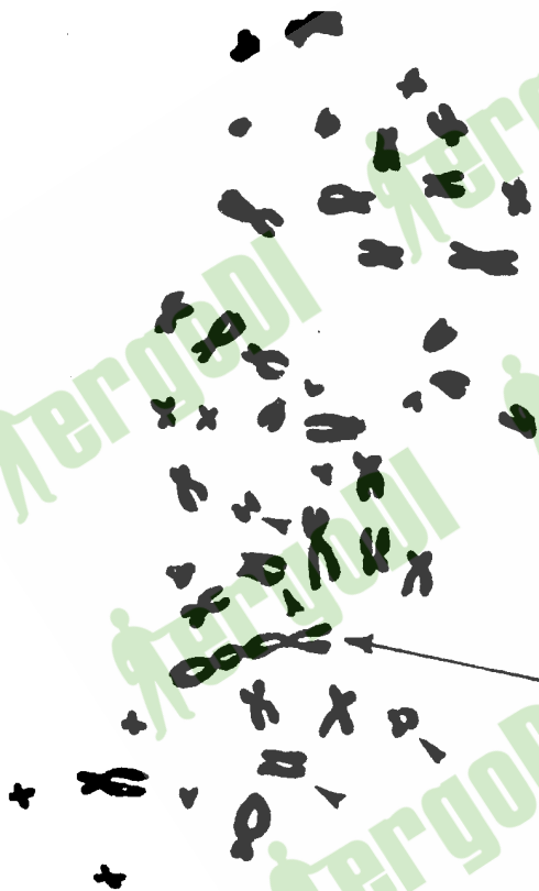
图 B4 三着丝粒和双着丝粒染色体及三对伴随的断片(箭头指处)

此种互换在某种程度上与染色体型的双着丝粒畸变形有些类似,断裂发生在两个染色体的单体上(图 B6)。