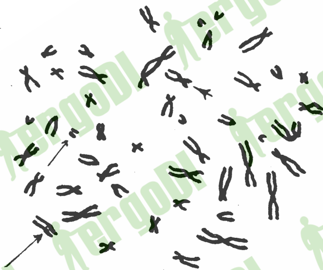
图 B2 无着丝粒断片(长箭头)和缺失(短箭头)

又称倒位,互换发生在同一个染色体内,即染色体的长臂和短臂上都出现一次横贯性断裂,接着是染色体倒位 180°,其断端再与两末端断片重接而成。这种畸变能否分辨出来,取决于着丝粒的位置改变是否明显(图 B1.h)。