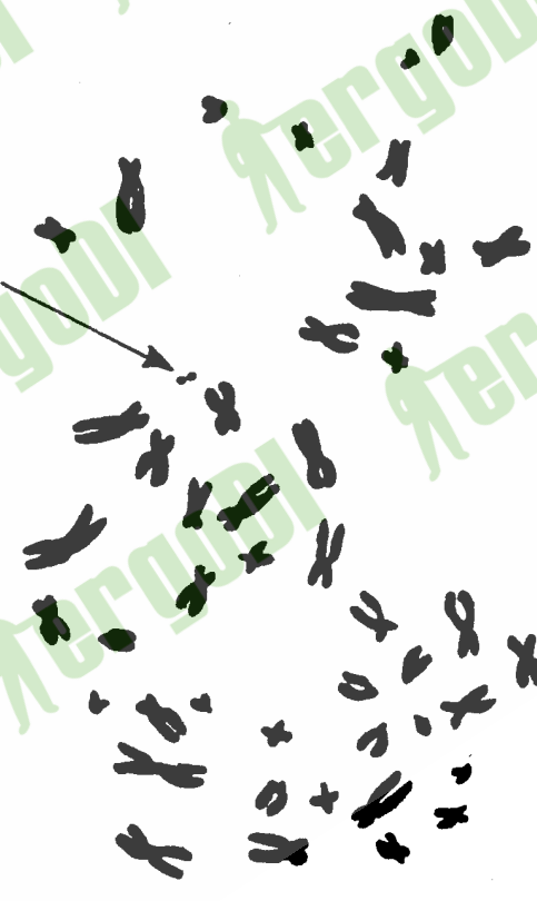
图 B5 中间缺失或称微小体(箭头指处)